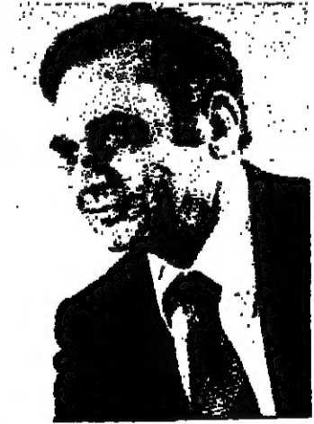
التعيين - اعلن رئيس الوزراء السيد مناحيم بيغن في جلسة مجلس الوزراء الاسبوعية امس عن تعيين السيد بنيامين غورابيه الذي يشغل حاليا منصب مستشار رئيس الوزراء للشؤون العربية بالوكالة في نفس المنصب بالاصالة .